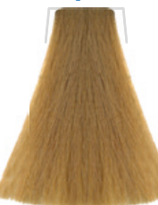
AMBRA CENERE / ASH AMBER AMBRE CENDRÉ / ÁMBAR CENCIENTO POPELAVÁ / JANTAROVÁ / BERNSTEIN ASCH ÁMBAR ACINZENTADO