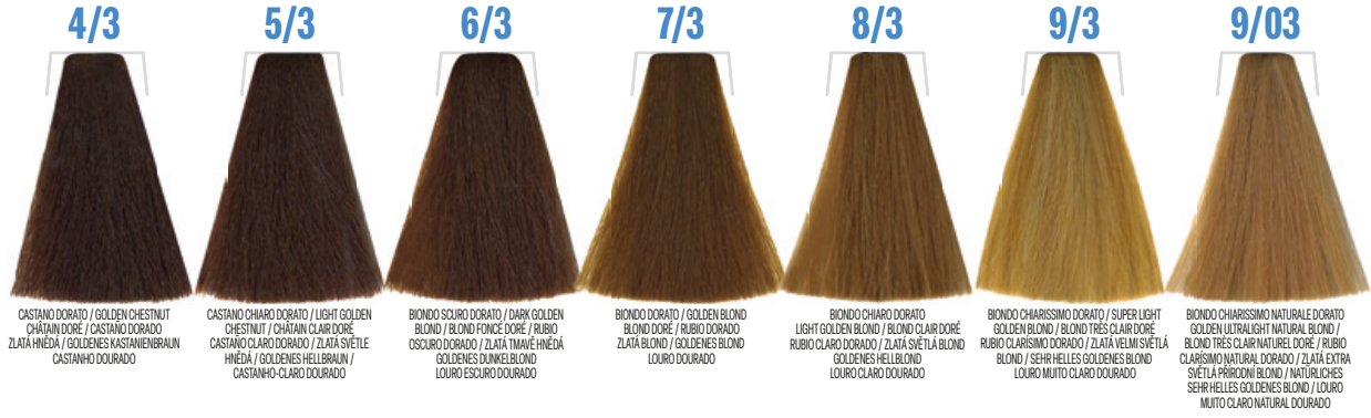
4/3 CASTANO DORATO / GOLDEN CHESTNUT / CHÂTAÎN DORÉ / CASTANO DORADO / ZLATÁ HNĚDÁ / GOLDENES KASTANIENBRAUN / CASTANHO DOURADO