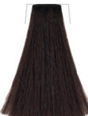
CASTANO SCURO / DARK CHESTNUT CHÂTAIN FONCÉ / CASTANO OSCURO TMÁVĚ HNĚDÁ / DUNKLES KASTANIENBRAUN CASTANHO-ESCURO