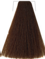
BIONDO PROFONDO / RICH BLONDE BLOND PROFOND / RUBIO PROFUNDO PLNÁ BLOND / TIEFES BLOND LOURO PROFUNDO