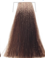
BIONDO BEIGE / TAWNY BLOND / BLOND BEIGE / RUBIO BEIGE / BEŽOVÁ BLOND / BEIGES BLOND LOURO BEIGE