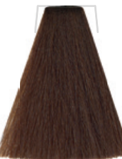
BIONDO SCURO / DARK BLOND BLOND FONCÉ / RUBIO OSCURO TMÁVÁ BLOND / DUNKELBLOND LOURO ESCURO