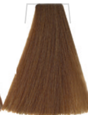
BIONDO CHIARO INTENSO / DEEP LIGHT BLONDE / BLOND CLAIR INTENSE INTENSE / RUBIO CLARO INTENSO INTENZIVNĚ SVĚTLÁ BLOND / INTENSIVS HELLBLOND / LOURO CLARO INTENSO