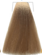
BIONDO CHIARISSIMO BEIGE / SUPER LIGHT TAWNY BLOND / BLOND TRÈS CLAIR BEIGE RUBIO CLARÍSSIMO BEIGE / BEŽOVÁ VELMI SVĚTLÁ BLOND / SEHR HELLES BEIGES BLOND LOURO MUITO CLARO BEIGE