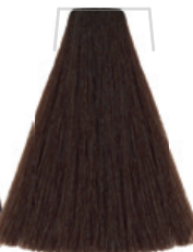
CASTANO CHIARO INTENSO / DEEP LIGHT CHESTNUT / CHÂTAIN CLAIR INTENSE INTENSE / RUBIO OSCURO INTENSO INTENZIVNĚ SVĚTLĚ HNĚDÁ / INTENSIVS HELLBRAUN CASTANHO-CLARO INTENSO