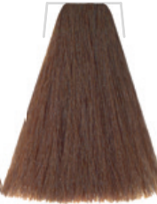
BIONDO SCURO MARRONE PERLA / DARK BLONDE PEARL BROWN / BLOND FONCÉ MARRON PERLE / RUBIO OSCURO MARRON NACARADO / TMÁVĚ ORISNOVÁ PERLETOVÁ BLOND / DUNKELBLOND-BRAUN PERLE / LOURO ESCURO MARRON NACARADO