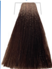
BIONDO SCURO BEIGE / DARK TAWNY BLOND / BLOND FONCÉ BEIGE RUBIO OSCURO BEIGE / BEŽOVÁ TMÁVÁ BLOND / BEIGES DUNKELBLOND LOURO ESCURO BEIGE