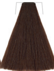
BIONDO SCURO INTENSO / DEEP DARK BLONDE / BLOND FONCÉ INTENSE / RUBIO OSCURO INTENSO INTENZIVNĚ TMÁVÁ BLOND / INTENSIVS DUNKELBLOND / LOURO ESCURO INTENSO