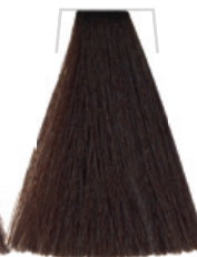
CASTANO / CHESTNUT / CHÂTAIN CASTANO / HNĚDÁ / KASTANIENBRAUN CASTANHO