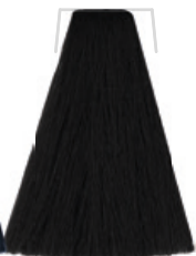
NERO / BLACK / NOIR / NEGRO ČERNÁ / SCHWARZ PRETO AZULADO