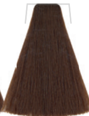
BIONDO INTENSO / DEEP BLONDE BLOND INTENSE / RUBIO INTENSO INTENZIVNĚ BLOND / INTENSIVS BLOND LOURO INTENSO