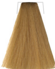
BIONDO CHIARISSIMO / SUPER LIGHT BLOND BLOND TRÈS CLAIR / RUBIO CLARÍSSIMO VELMI SVĚTLÁ BLOND / SEHR HELLES BLOND LOURO MUITO CLARO