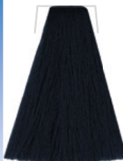
NERO BLEU / RAVEN BLACK / NOIR BLEU NEGRO AZUL / MODORO ČERNÁ BLAUSCHWARZ / PRETO AZULADO