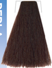
CASTANO MARRONE PERLA / CHESTNUT PEARL BROWN / CHÂTAIN MARRON PERLE CASTANO MARRON NACARADO / ORISNOVÁ PERLETOVÁ HNĚDÁ / KASTANIENBRAUN PERLE / CASTANHO MARRON NACARADO