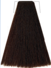
CASTANO CHIARO PROFONDO / RICH LIGHT CHESTNUT / CHÂTAIN CLAIR PROFOND CASTANO CLARO PROFUNDO / PLNÁ SVĚTLĚ HNĚDÁ / TIEFES HELLBRAUN CASTANHO-CLARO PROFUNDO