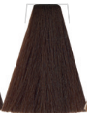
CASTANO CHIARO / LIGHT CHESTNUT CHÂTAIN CLAIR / CASTANO CLARO SVĚTLĚ HNĚDÁ / HELLBRAUN CASTANHO-CLARO