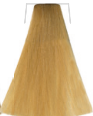
BIONDO PLATINO / PLATINUM BLONDE BLOND PLATINE / RUBIO PLATINO PLATINOVÁ BLOND / PLATINBLOND LOURO PLATINA