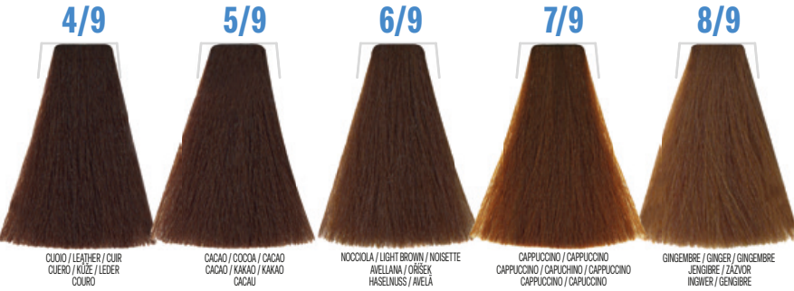
4/9 CUIO / LEATHER / CUIR / CUERO / KÜZE / LEDER / COURO