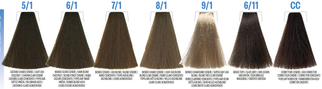
5/1 CASTANO CHIARO CENERE / LIGHT ASH CHESTNUT / CHÂTAÎN CLAIR CENDRÉ CASTANO CLARO CENCIENTO / POPELAVÁ SVĚTLĚ HNĚDÁ / HELLBRAUN ASCH / CASTANHO CLARO ACINZENTADO