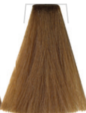
BIONDO CHIARO / LIGHT BLOND BLOND CLAIR / RUBIO CLARO SVĚTLÁ BLOND / HELLBOND LOURO CLARO