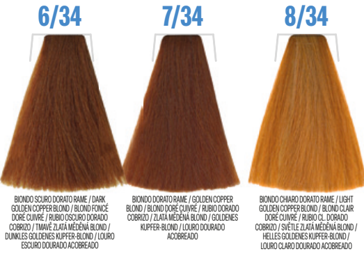
6/34 BIONDO SCURO DORATO RAME / DARK GOLDEN COPPER BLOND / BLOND FONCÉ DORÉ CUIVRE / RUBIO OSCURO DORADO COBRIZO / TMĚVĚ ZLATÁ MEDĚNÁ BLOND / DUNKLES GOLDENES KUPFER-BLOND / LOURO ESCURO DOURADO ACOBRÉADO