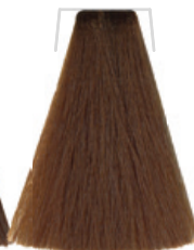
BIONDO / BLOND BLOND / RUBIO BLOND / BLOND LOURO