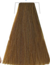
BIONDO CHIARO BEIGE / LIGHT TAWNY BLOND / BLOND CLAIR BEIGE RUBIO CLARO BEIGE / BEŽOVÁ SVĚTLÁ BLOND / BEIGES HELLBOND LOURO CLARO BEIGE