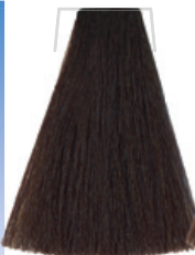
CASTANO INTENSO / DEEP CHESTNUT CHÂTAIN INTENSE / CASTANO INTENSO INTENZIVNĚ HNĚDÁ INTENSIVS KASTANIENBRAUN CASTANHO INTENSO