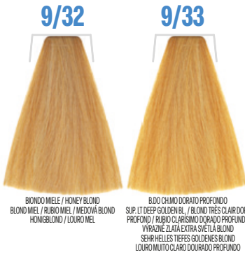
9/32 BIONDO MIELE / HONEY BLOND / BLOND MIEL / RUBIO MIEL / MEDOVÁ BLOND / HONIGBLOND / LOURO MEL